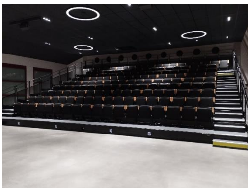
Vue depuis la salle multiculturelle

Tarifs et conditions de mise à disposition Cf fiche « grille tarifaire »